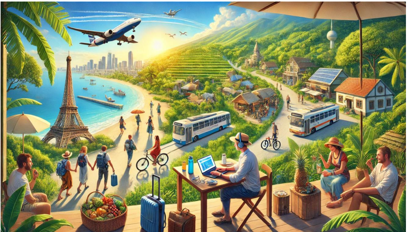
KI-generiert (DALL-E 2 OpenAi, 2025)