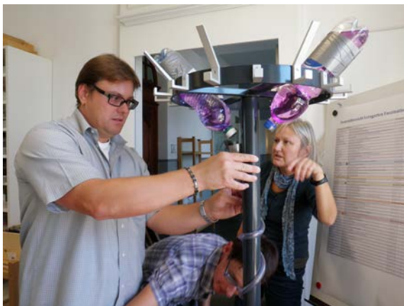
Entdeckendes Lernen im RDZ Rorschach