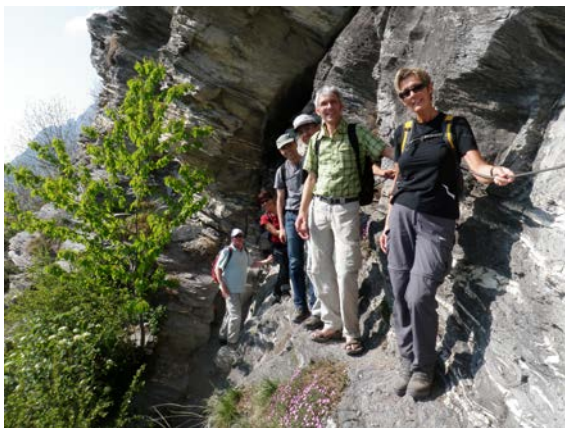
Herausforderungen spornen an