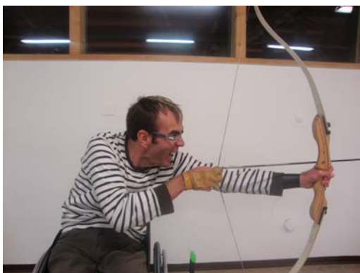
Ziel im Blick