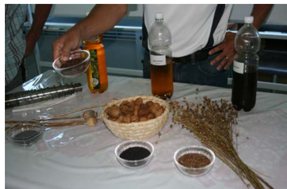
Wie wird Nussöl hergestellt?