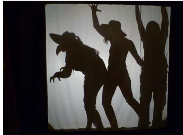
Licht und Schatten im RDZ Gossau