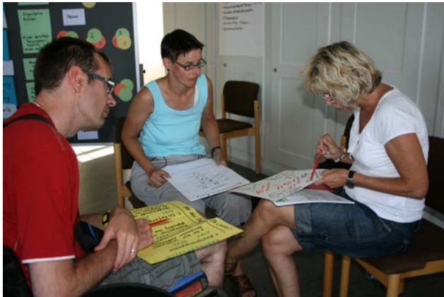
Wechselseitiges Lehren und Lernen