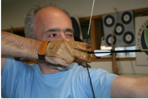
Sich Ziele setzen