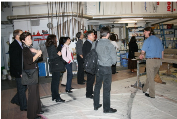
Hinter die Kulissen blicken