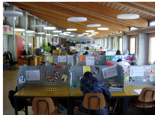
Neue Schulformen erleben