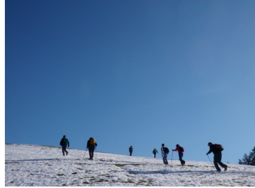
Seine eigene Spur finden