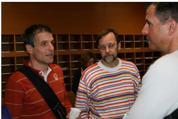
Mit Berufsschullehrpersonen austauschen