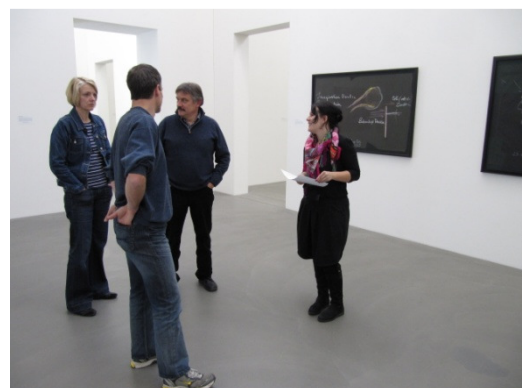
Sich in pädagogische Ideen vertiefen