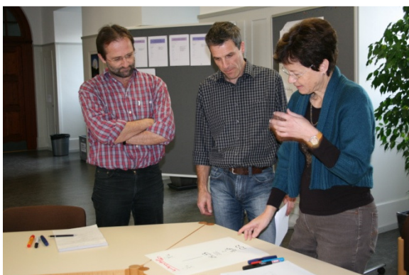
Durch lehren lernen