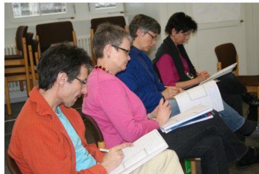
Im Tagebuch verarbeiten