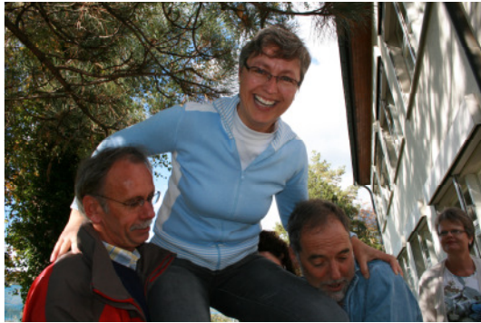
Gegenseitige Unterstützung erleben