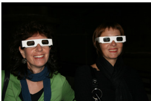
Sich überraschen lassen