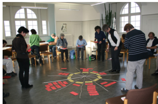
Im Plenum arbeiten