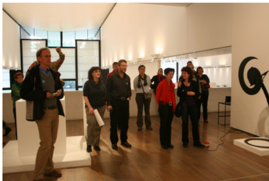
Sich kulturell weiter bilden