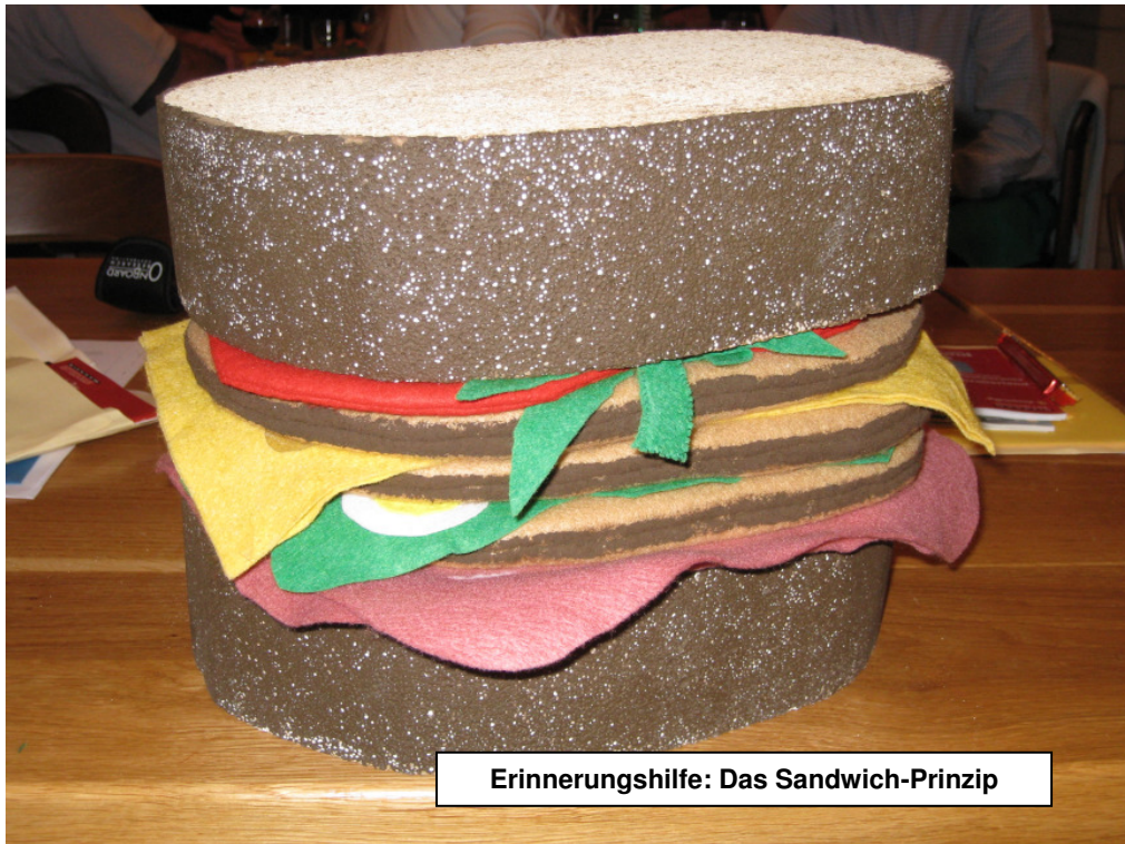
Erinnerungshilfe: Das Sandwich-Prinzip