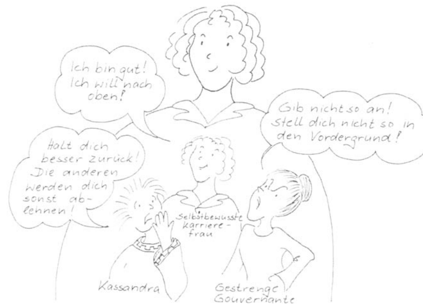
Abbildung 8: Das ambivalente Verhältnis vieler Frauen zu Erfolg

Dagmar Kumbier (2006): «Sie sagt, er sagt»