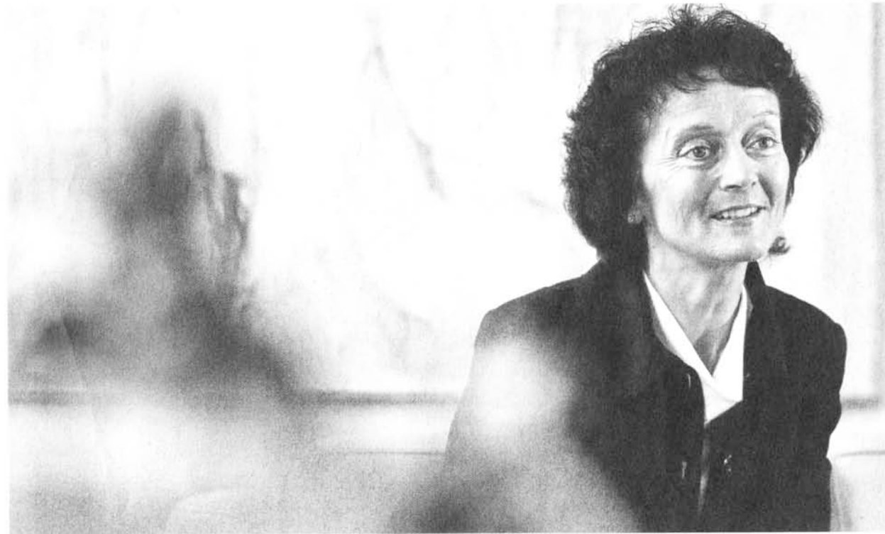
Doppelte Bundesrätin. Eveline Widmer-Schlumpf führt derzeit mühelos zwei Departemente.