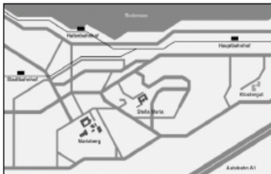
Hochschulgebäude Marienberg und Stella Maris Rorschach