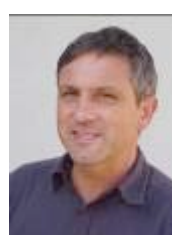
Fabio Pasqualini Mediathek / Medienwerkstatt