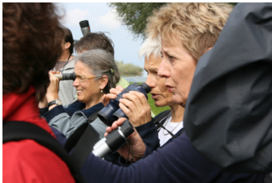
Interessen entwickeln – forschen