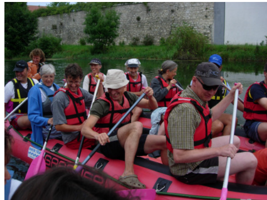
Gemeinsam im Boot sein