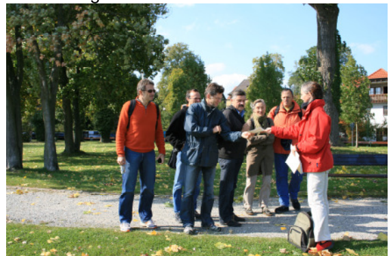
Die Umgebung kennen lernen