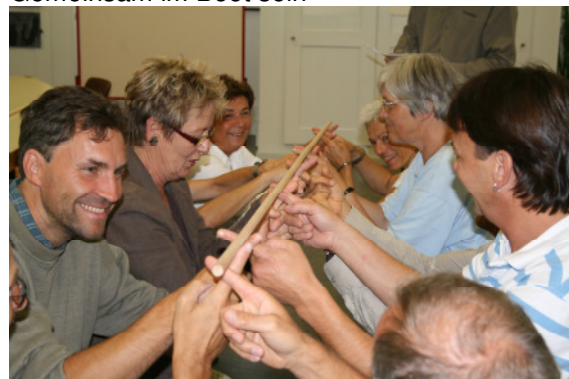
Aufgaben in Gruppen lösen